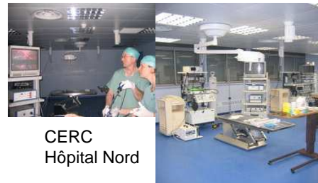
CERC Hôpital Nord