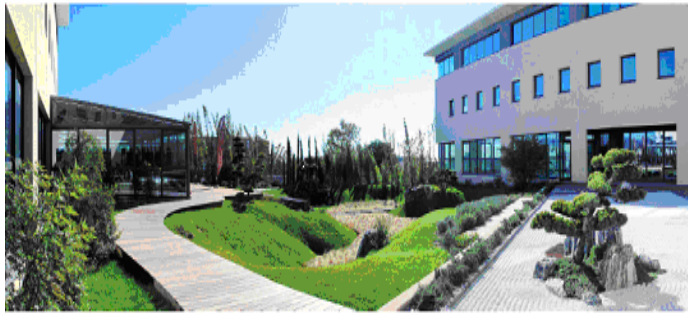
Cité de la Cosmétique

L'Archipel du Dispositif Médical Marseille Provence est doté d'un comité de pilotage composé de 3 collèges (collège industriels, collège académiques et collège institutionnels)