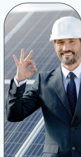
Maintenance & Entretien des locaux