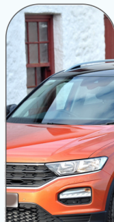
Véhicules & Transports

Nous négocions régulièrement les meilleures conditions tarifaires auprès de plus de 100 fournisseurs