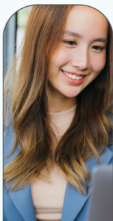
Finance & Ressources Humaines