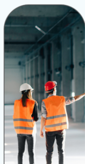
Achats industriels & spécifiques

60 catégories d'achats dans 6 domaines d'intervention